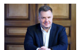
Luca Anglestri Asset Management